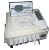
Panneau de commande digital et boîtier de contrôle